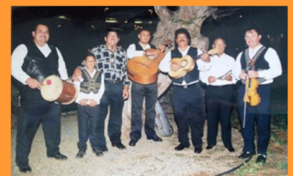
Tipico del Campo